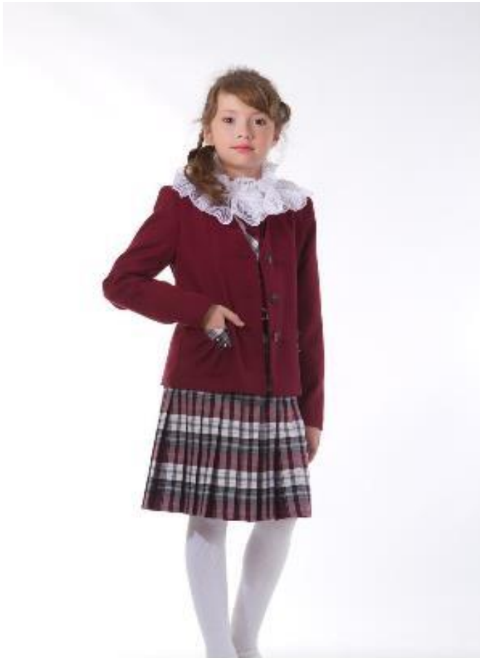
жакет 3054 р-р 56-84