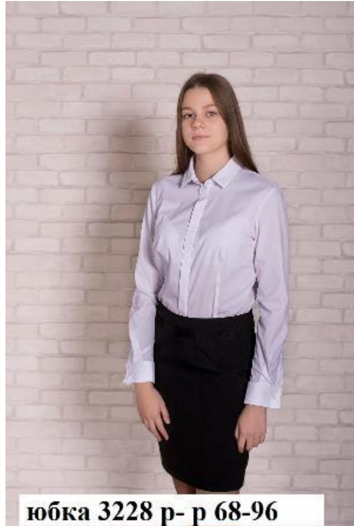
юбка 3228 р- р 68-96