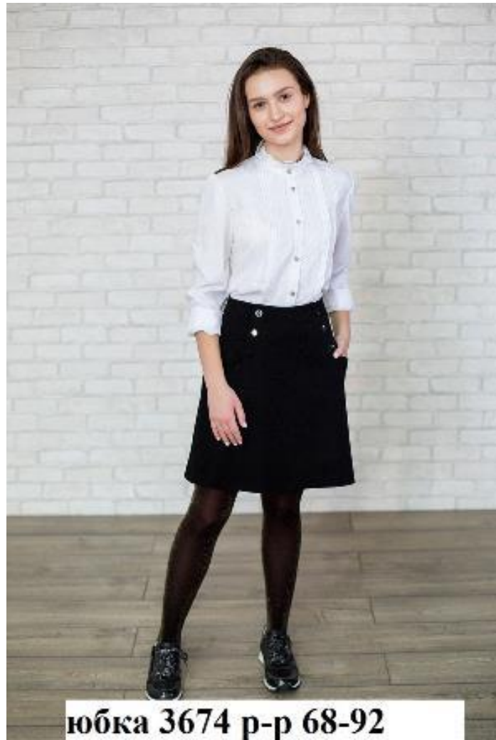
юбка 3674 р-р 68-92