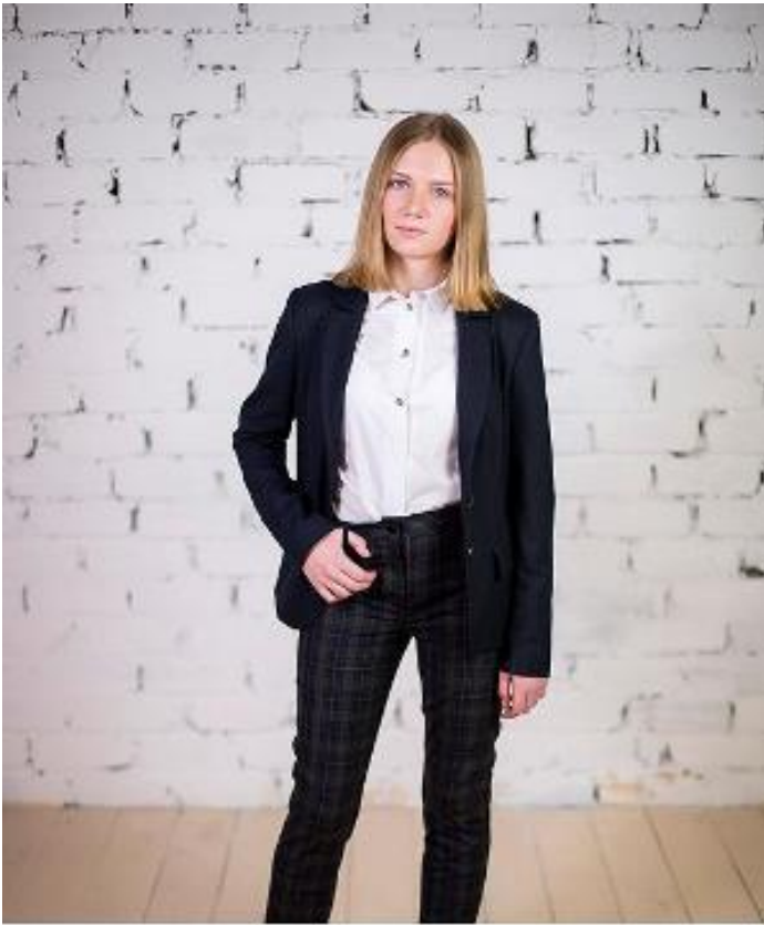
жакет 3680 р-р 68-92