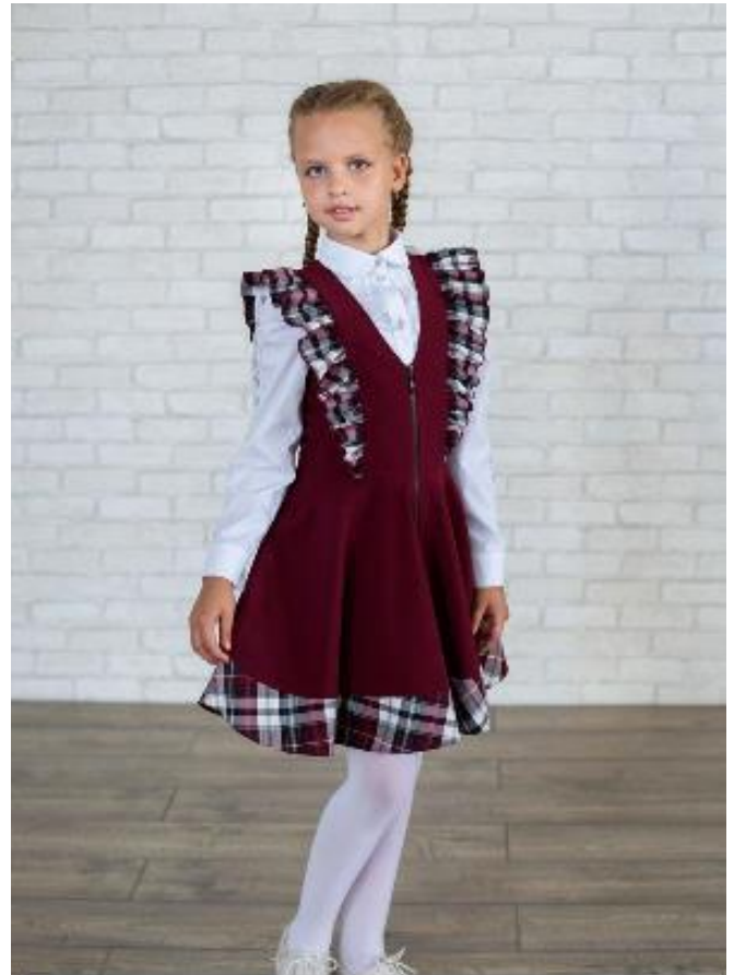
сарафан 3635 р-р 56-84