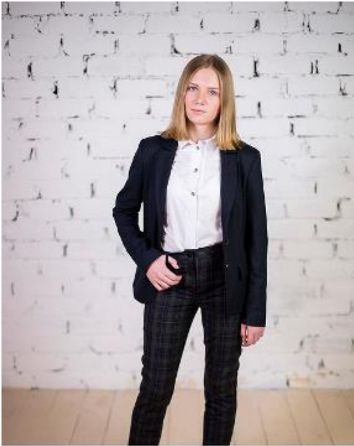
жакет 3680 р-р 68-92